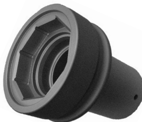
Attrezzo speciale FMB 40

L'offerta degli accessori è riportata a tergo.