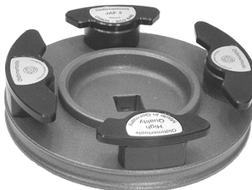
Attrezzo speciale JAF 2

L'offerta degli accessori è riportata a tergo.