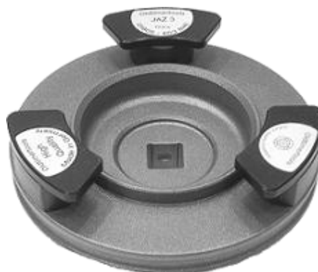
Attrezzo speciale JAZ 3

L'offerta degli accessori è riportata a tergo.