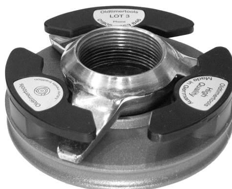
Attrezzo speciale LOT 3

L'offerta degli accessori è riportata a tergo.